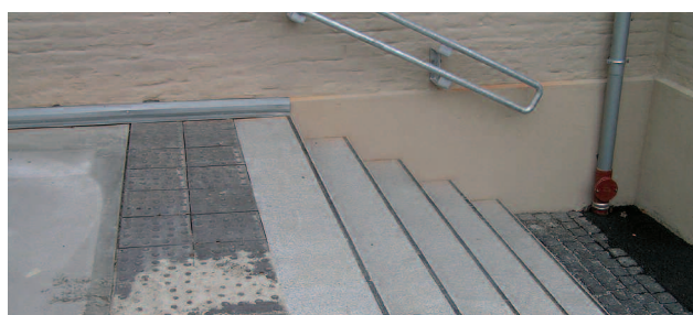
Markering av trappeneser samt varselfelt.