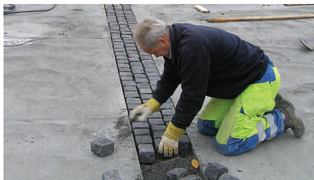
Gangsoner avgrenses av smågatestein.

Men i Kongsvinger innser de at det trengs tid og ressurser på å opparbeide et kunnskapsnivå som sikrer gode universelle løsninger.